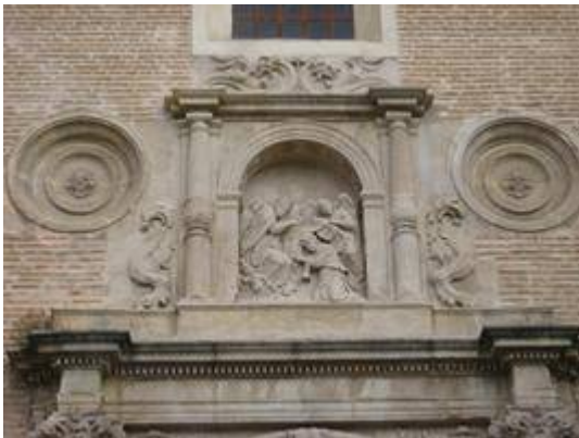
Detail of the facade of the church of San Ildefonso.