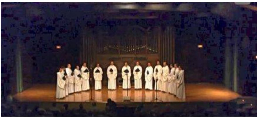
Psalm 94 and responsory Libera me . Schola Antiqua. Music for a good death. Requiem . Fundación Juan March