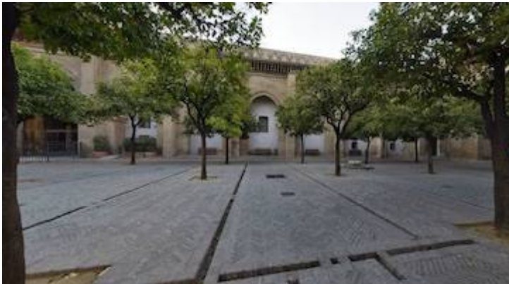
Patio de los Naranjos (360°). Cathedral