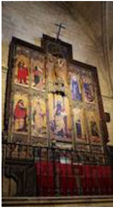
Chapel of San Bartolomé = Chapel of Santa Ana. Cathedral.