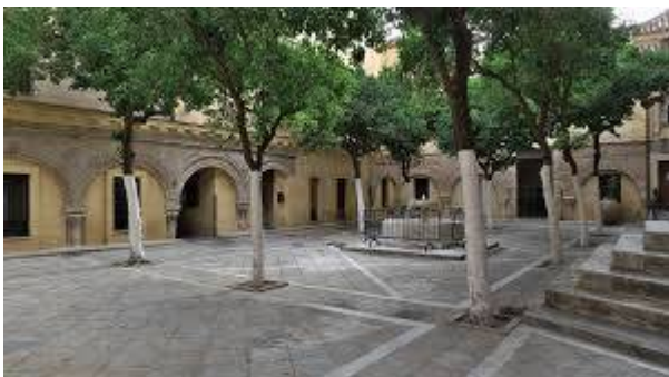
The Almohad mosque of Ibn Adabbas. Video by Elisa Simon