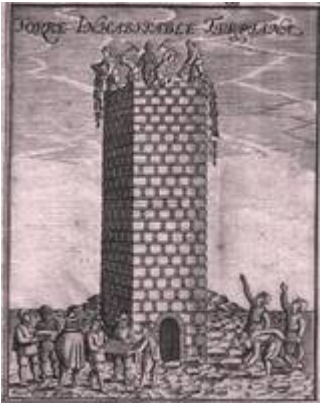
Turpiana tower (minaret of the aljama mosque). Francisco Heylan (17th century)

"http://www.youtube.com/embed/Sdyb8ySwdmM?iv_load_policy=3&fs=1&origin=http://www.historicalsoundscapes.com"