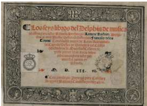
Los seis libros del Delphin. Luis de Narváez