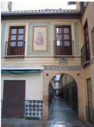
Gate of the Alcaicería.