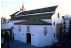
Church of San Julián. Description of the building and some historical facts