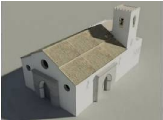
The mudéjar church in Seville. Video by Consejería de Cultura. Junta de Andalucía