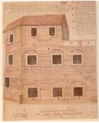
South facade of the public prison of Seville. Madrid. Archivo Histórico Nacional