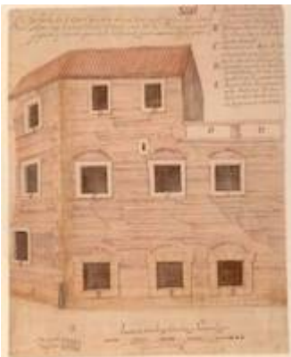
South facade of the public prison of Seville. Madrid. Archivo Histórico Nacional

"http://www.youtube.com/embed/FoZLaH-E5N4?iv_load_policy=3&fs=1&origin=http://www.historicalsoundscapes.com"