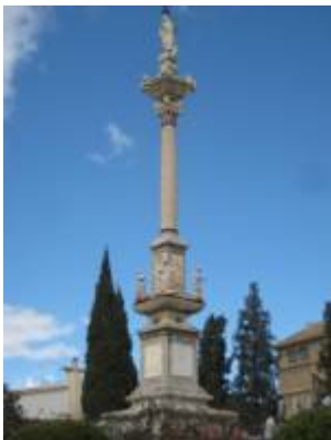
Monument to the triumph of the Immaculate Conception.