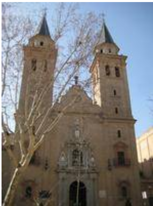
Church of Nuestra Señora de las Angustias (facade).