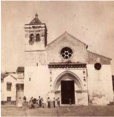
Iglesia de Santa Lucía