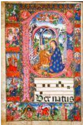
Catedral de Sevilla. Librería de coro, libro gigante nº 65, fol. 1v.