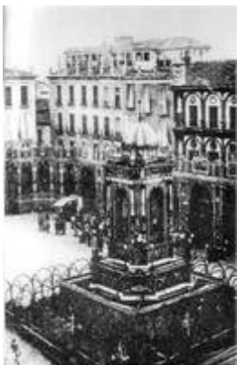
Bibarrambra square. Casa de los Miradores (s. XIX)