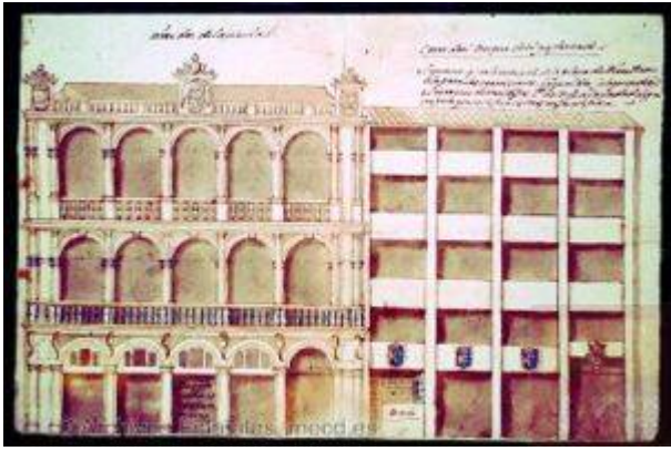
Houses of the duke of the Infantado in the Bibarrambla square