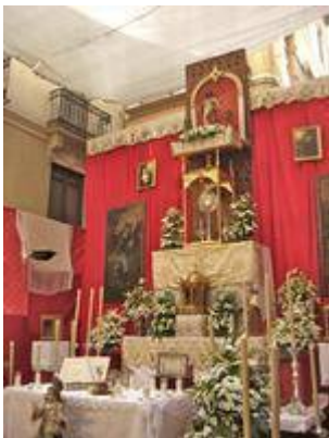
Altar for the Corpus Christi procession in 2016 (Mesones street).