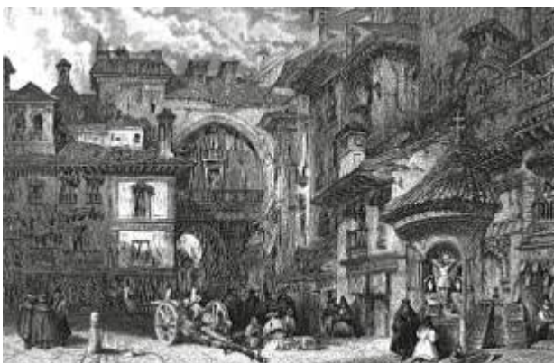
Arco de las Orejas in Bibarrambra. David Roberts (1836)