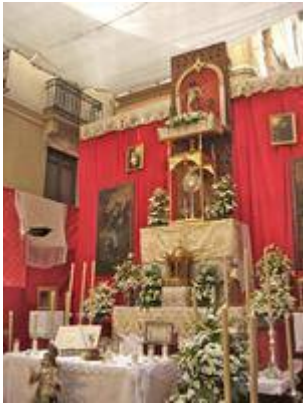
Altar for the Corpus Christi procession in 2016 (Mesones street).