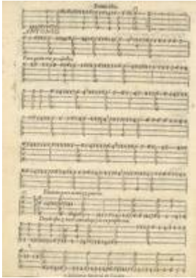
"Para quién crié yo cabellos". Antonio de Cabezón. Luis Venegas de Henestrosa. Libro de cifra nueva para tecla, arpa y vihuela (Alcalá de Henares, Juan de Brocar, 1557), fol. 66v.