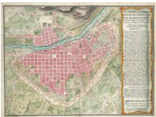
Plano de la Ciudad de los Reyes, o Lima, capital del reino de Perú. Ignacio Martorell (1780)