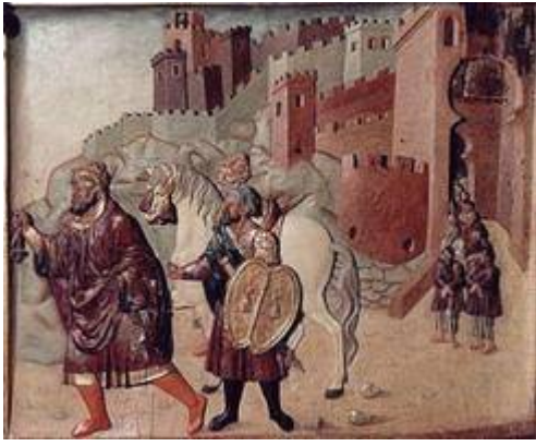
Boabdil handing the keys of the city. Altarpiece's predella of the Capilla Real of Granada. Felipe Vigarny (1520-1522)