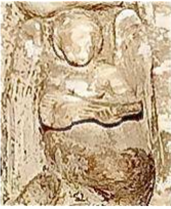
Angel playing a cittern. Tomb of Archbishop Gonzalo de Mena (c. 1401). Picture by Teresa Laguna Paúl