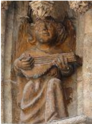
Angel playing the lute. Puerta del Nacimiento (c. 1470). Cathedral of Seville