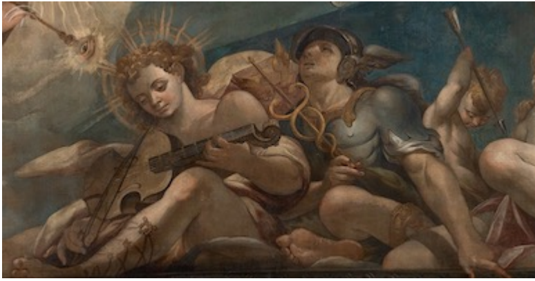
Apolo. Attributed to Alonso Vázquez