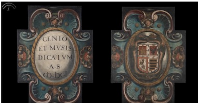
The restoration project of the paintings on the ceiling of Arguijo's house