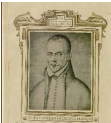
Portrait of Francisco Peraza I. Francisco Pacheco. Libro de descripción de verdaderos retratos de ilustres y memorables varones