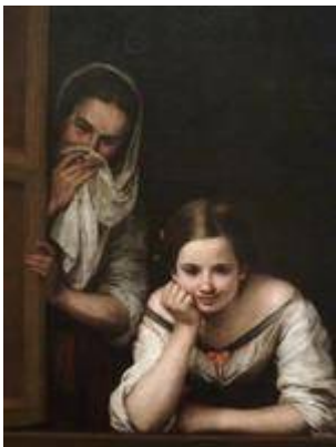
Two Women at a Window . Bartolomé Esteban Murillo (c.1655/1660)