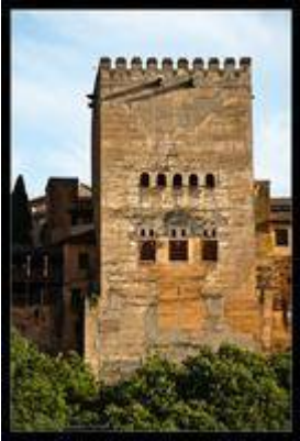
Torre de Comares.