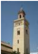
Church of San Marcos.