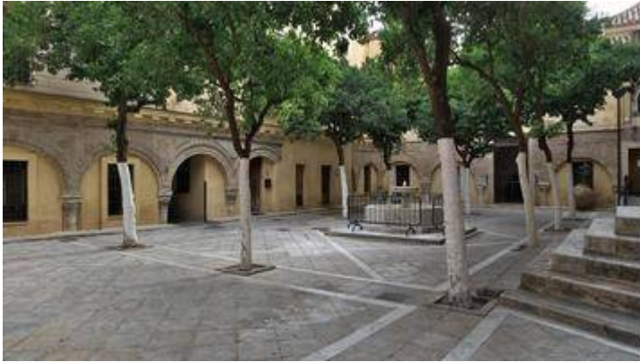
Courtyard of the church of San Salvador