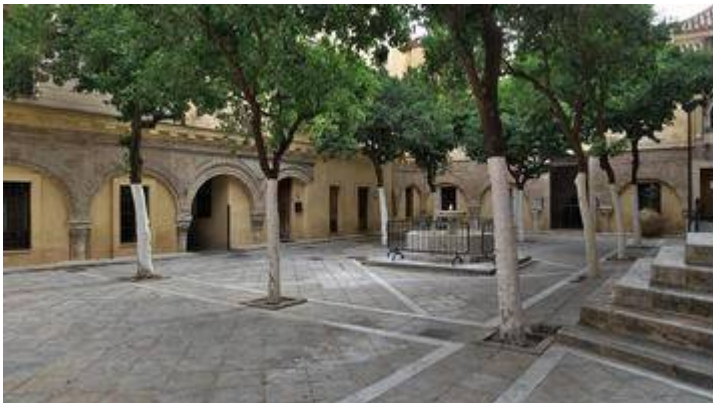
Courtyard of the church of San Salvador