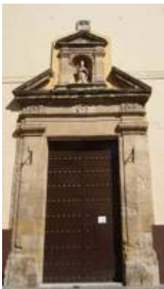
Church of San Nicolás. Some historical and artistic facts