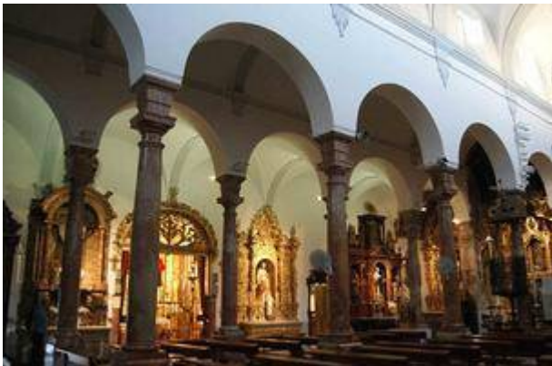
Church of San Nicolás. Gospel's nave.