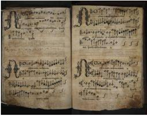
Pange lingua . [Francisco Guerrero]. Archivo de la catedral de Sevilla. Subfondo capilla de música, Libro de polifonía nº 2 [E-Sc 2], fols. 48v-49r