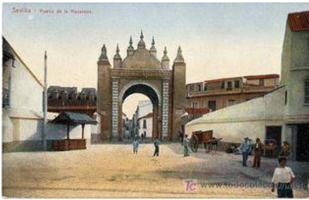
Gate of la Macarena (c. 1900)