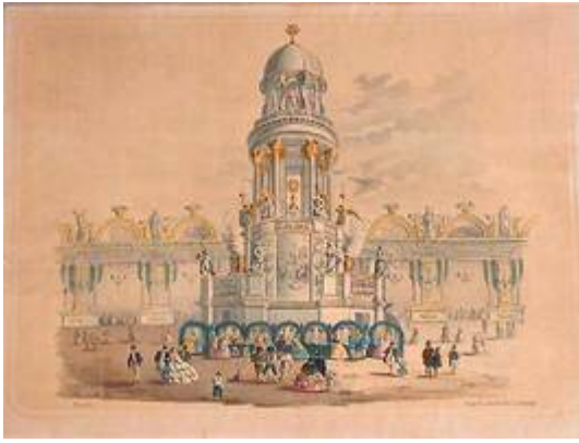
Altar of Corpus Christi in Bibarrambla (1859)

"http://www.youtube.com/embed/AltotawqKNA?iv_load_policy=3&fs=1&origin=http://www.historicalsoundscapes.com"