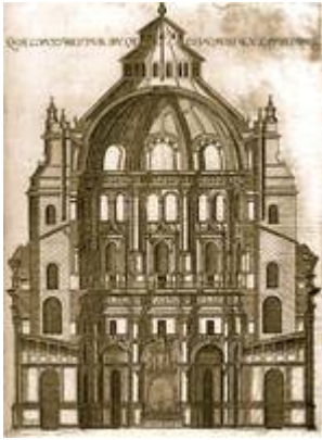
The main chapel. Cathedral of Granada. Francisco de Heylan