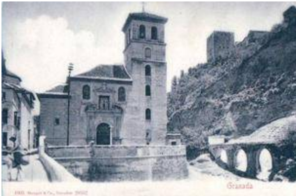
Church of San Pedro (1905)