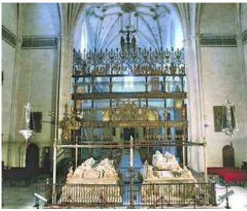
Capilla Real of Granada