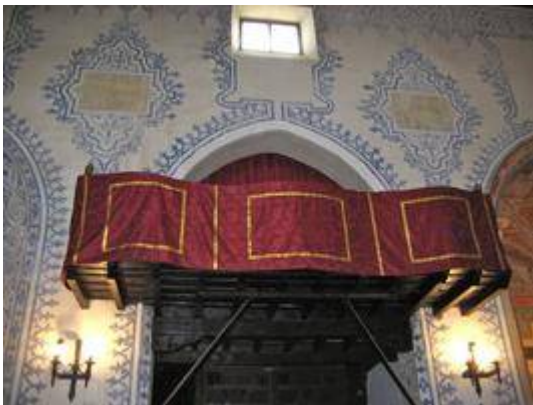
Organ loft of the church of San Miguel