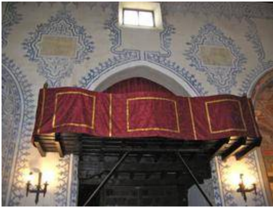
Organ loft of the church of San Miguel