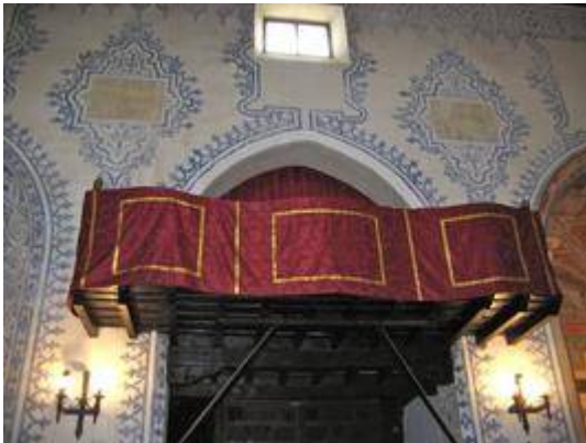
Organ loft of the church of San Miguel