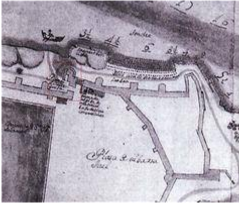
The Blanquillo (al sitio del Patín). Pedro Juan de Laviesca (1743)

"http://www.youtube.com/embed/rpsJJDBekGI?iv_load_policy=3&fs=1&origin=http://www.historicalsoundscapes.com"