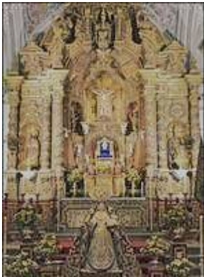
Altarpiece of the convent of la Madre de Dios. Picture by Antonio Orantes