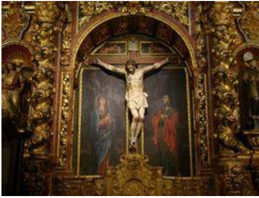
Chapel of el Cristo de las Ánimas. Church of San Ildefonso.