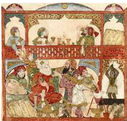
Domestic scene with luth