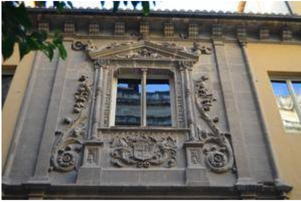
Facade of the college of Niñas Nobles. Juan de Marquina (c. 1530). Picture by Sara Guerri