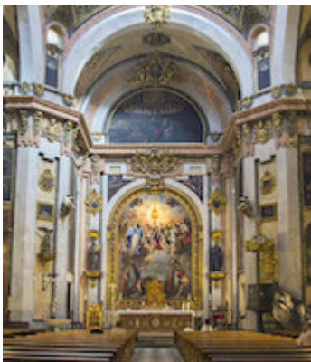
Convent of El Corpus Christi (inside)