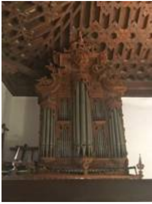
Organ of the convent of Santa Isabel la Real