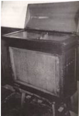
Portative organ from the convent of Santa Isabel la Real.