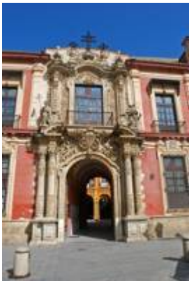
Palacio arzobispal of Sevilla.