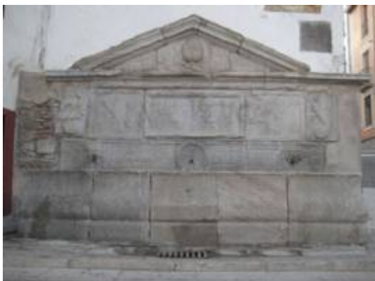
Fountain in the cuesta del Realejo (1616).