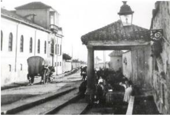
Old fountain of Fuente Nueva -1- (in Camino de la Fuente Nueva street)