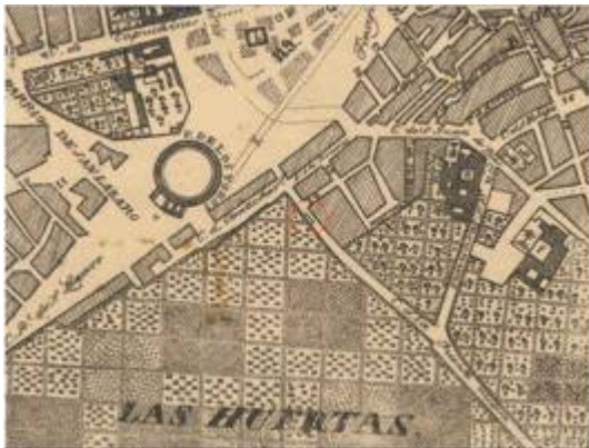
Old fountain of Fuente Nueva. Plano topográfico de Francisco Martínez Palomino (1845)