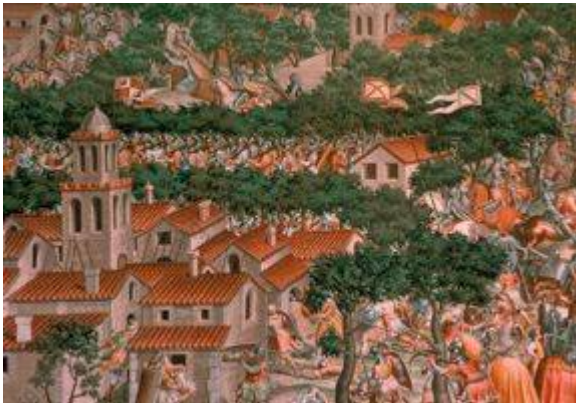
Higueruela's Battle (6)