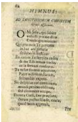
Septenario sacro... al Santísimo Cristo de la Luz (1759)