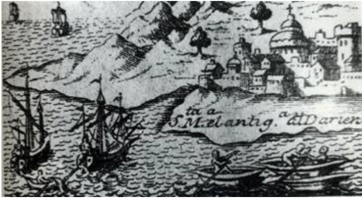
Historia general de los hechos de los castellanos en las islas y tierra firme... (Madrid, 1726)