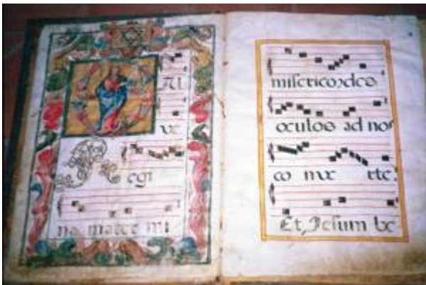
Salve regina. Choirbook XLII.

"http://www.youtube.com/embed/x27KXOM0rLg?iv_load_policy=3&fs=1&origin=http://www.historicalsoundscapes.com"